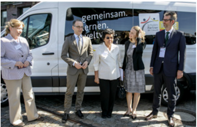
Bundesminister Maas begrüßt in Berlin Gäste aus Thailand, Brasilien und Spanien vor dem PASCH-Mobil